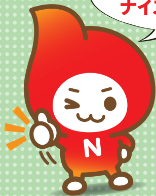
明治ナイスデイ保険キャラクター ナイスくん